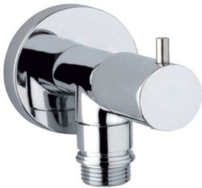
Immagine Prodotto - Product Image

Robinet d'arrêt avec tête à disques céramiques 1/2" M Llave de paso con cartucho de discos céramicos, de 1/2" M Запорный кран на 1/2" M с керамическими дисками