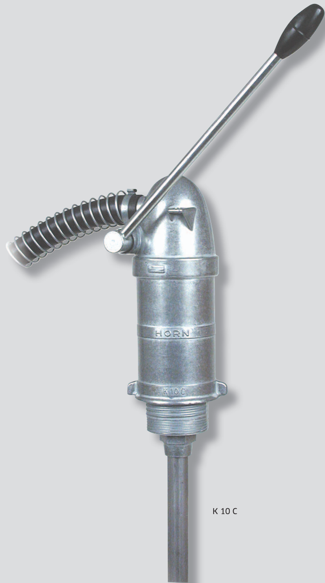
K 10 C