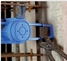
5 Einfach auf die Stahlarmierung binden, Betondeckung bis 40 mm.