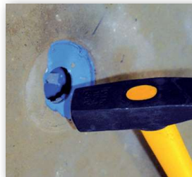
7 Ausschlagen des Dosendeckels.