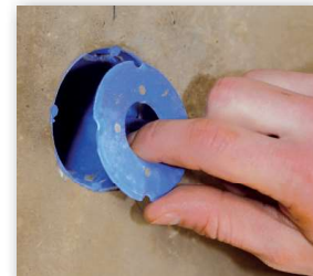
8 Dosendeckel herausnehmen – fertig!