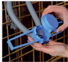
3 Dosendeckel aufdrücken.