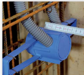
6 Die Montage der umgedrehten Flügelbetondose ermöglicht auch eine Betondeckung bis 60 mm.