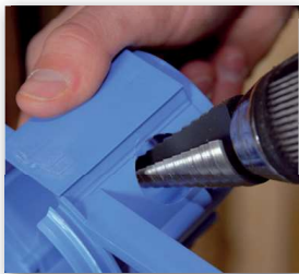
1 Rohrlöcher ausbohren.