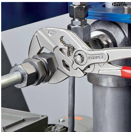
ersetzt einen Satz Schraubenschlüssel, metrisch wie zöllig