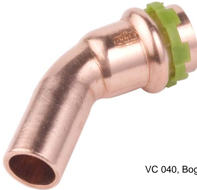
VC 040, Bogen 45°, I/A