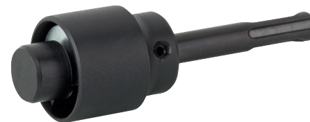
1x Hahnverlängerungsfräser Zum wandbündigen Abschälen überstehender Wandwinkel oder Hahnverlängerungen