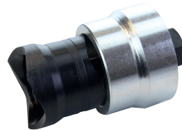
1x Doppel-Schraubloch-Stanze 32/35 mm Zur Erstellung der Armaturenlöcher in Nirosta-Spülbecken