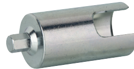
1x Eckventil Einschraubhilfe Zum beschädigungsfreien Ein- und Ausschrauben von Eckventilen