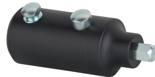
1x Montagewerkzeug für Abflussventile Zum Ein- und Ausdrehen von Excenter Waschtischventilen